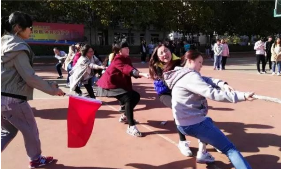
得第二名，管理学院获得第三名。比赛在欢声笑语的和谐氛围中圆满结束！