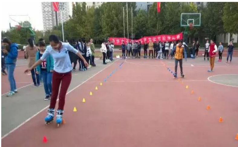
得第二名，管理学院获得第三名。比赛在欢声笑语的和谐氛围中圆满结束！